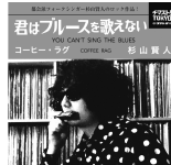
君はブルースを歌えない