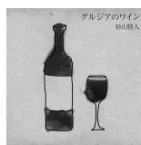
グルジアのワイン