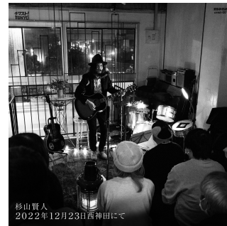
2022年12月23日西神田にて 2,000円＋税