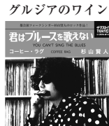
グルジアのワイン