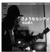
先月、CDアルバムから一曲さようならシティを配信リリースいたしました。下記QRリンクからぜひ！