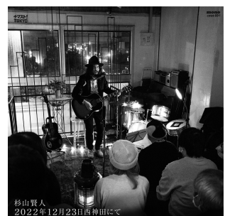
2022年12月23日西神田にて 2,000円+税