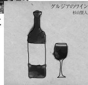
グルジアのワイン